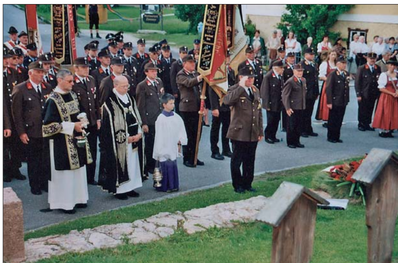
Heldenehrung mit Kranzniederlegung am Heldenfriedhof

Bei der anschließenden Florianifeier vor dem Gemeindegemeindeamt konnten wieder einige Kameraden geehrt und befördert werden. Besonders erfreulich war, dass wir wieder 7 junge Kameraden zum Dienst in der Feuerwehr angeloben konnten.