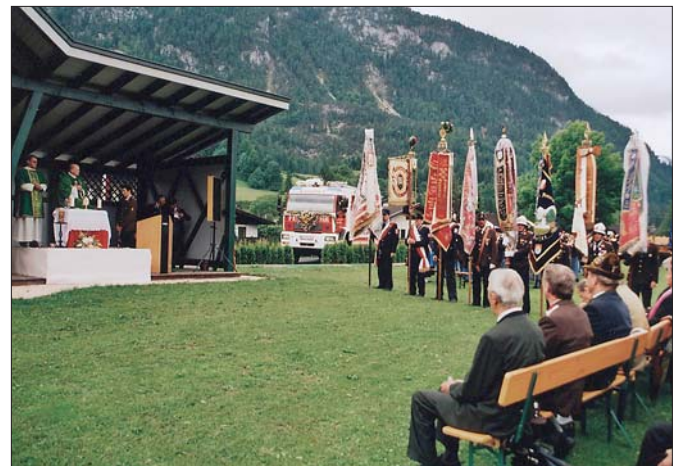
Feldmesse zum Jubiläumsfest

Nach diesem Bezirksbewerb stellten sich die beiden Gruppen aus Unken, für das Landesfeuerwehrleistungsabzeichen am 18. Juni 2005 in Bronze und Silber beim Landesbewerb in St. Margarethen im Lungau und meisterten diesen mit Bravour. Um diese Erfolge feiern zu können mussten sie monatelang hart und regelmäßig trainieren.