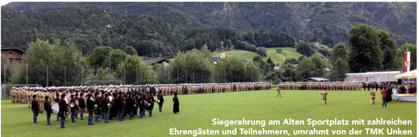
Siegerehrung am Alten Sportplatz mit zahlreichen Ehrengästen und Teilnehmern, umrahmt von der TMK Unken