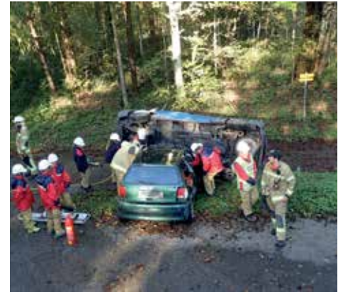
Technische Übung Verkehrsunfall

Neben all den Übungen und Schulungen blieb auch für Ausflüge und weitere Highlights noch genügend Zeit.