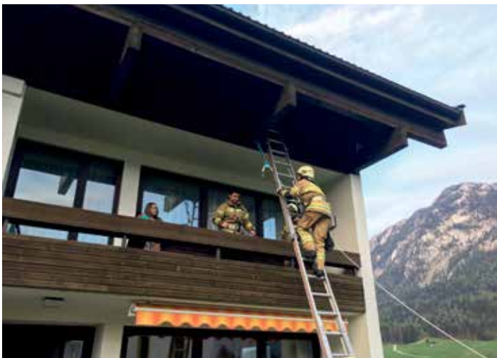
Übung Höhenrettung beim Pfarrhof