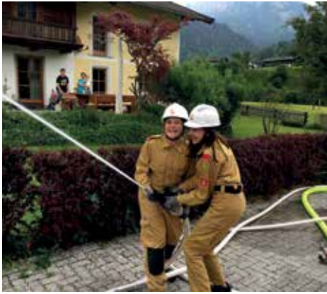
Löschübung in Reit

Für die Jungs und Mädels der Unkener Feuerwehrjugend war 2017 wieder ein ereignisreiches und spannendes Jahr. Es begann mit dem Wissenstest in Dienten wo die Kids in den Stufen Gold, Silber und Bronze wieder ihr Können unter Beweis stellen konnten. Viel Zeit wurde wieder in die praktische Ausbildung investiert. Es wurden verschiedenste Themenbereiche abgedeckt, etwa Brandbekämpfung, Personenrettungen oder Technische Hilfeleistungen.