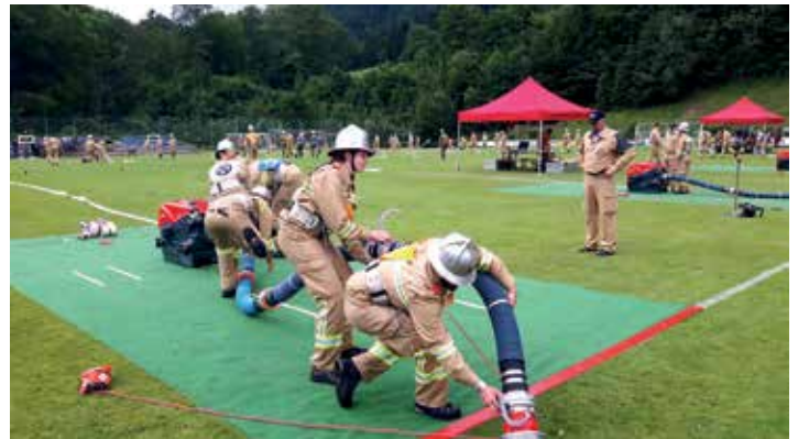
Gruppe Unken beim Löschangriff