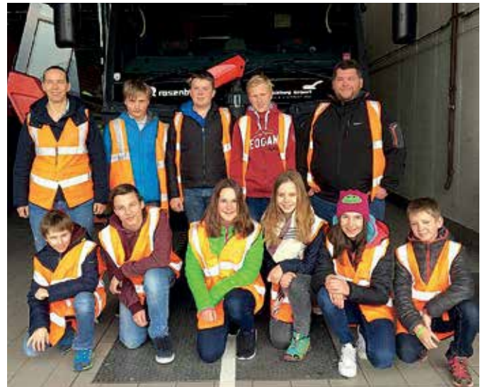
Spannender Ausflug zur Flughafenfeuerwehr