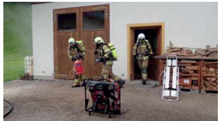
Bergung von Gefahrgütern beim Fellnerbauer