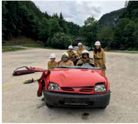
Übung mit der Bergeschere