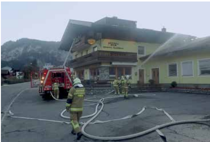
Brandübung bei der Bäckerei Ellmayer

Für die Wasserentnahme aus der Beschneigungsanlage wurde eine neue technische Ausrüstung getestet.