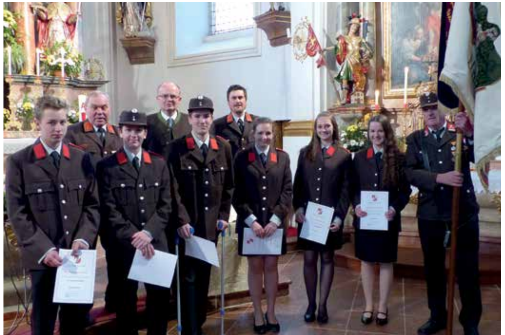
Angelobung der neuen aktiven Feuerwehrmitglieder