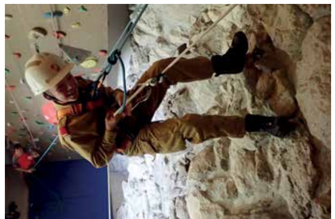
Kletterübung beim 24-Stunden-Tag