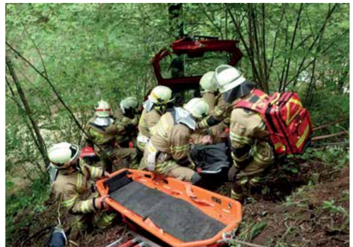
Personenrettung im steilen Gelände