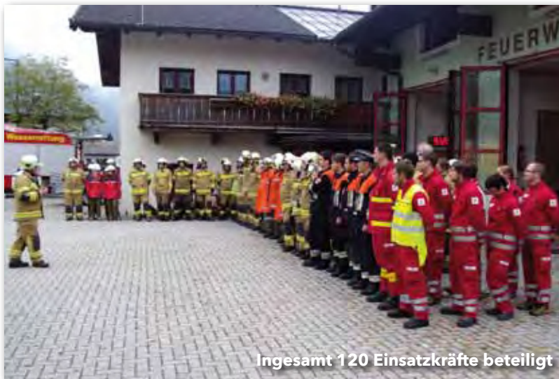
Insgesamt 120 Einsatzkräfte beteiligt