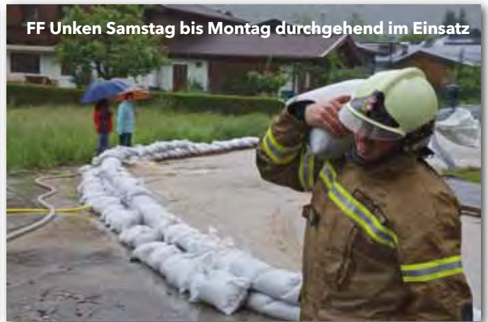
FF Unken Samstag bis Montag durchgehend im Einsatz