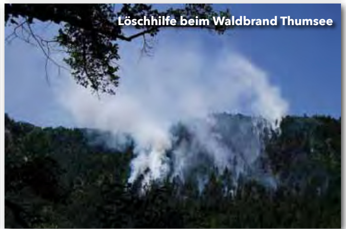
Löschhilfe beim Waldbrand Thumsee