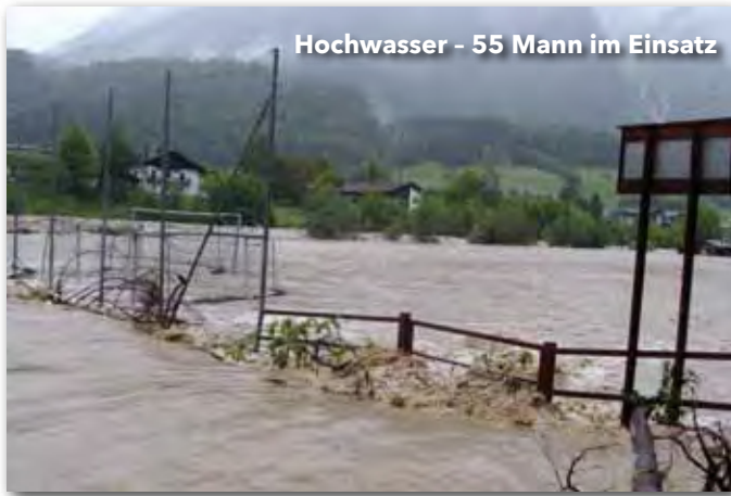
Hochwasser - 55 Mann im Einsatz