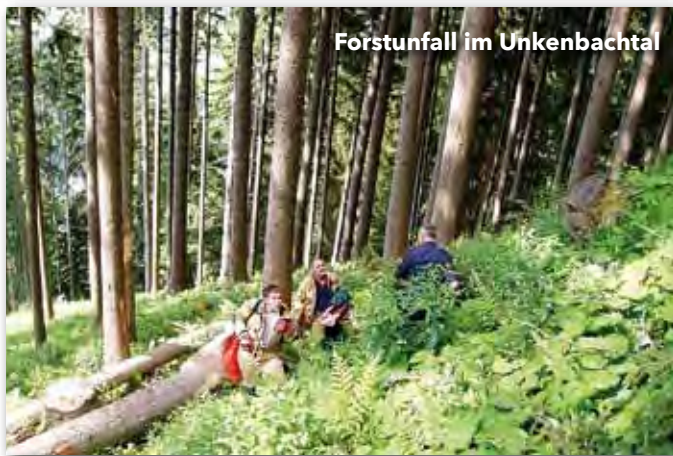
Forstunfall im Unkenbachtal