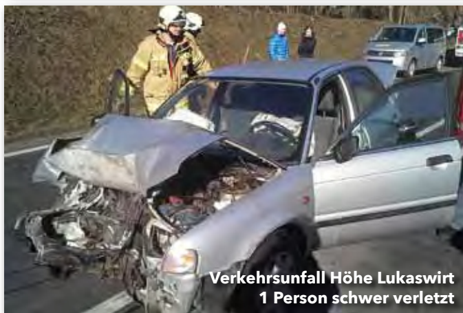
Verkehrsunfall Höhe Lukaswirt 1 Person schwer verletzt