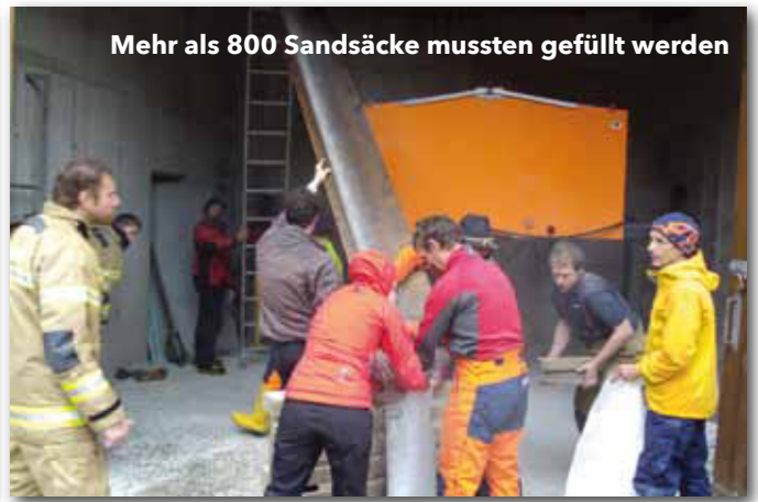
Mehr als 800 Sandsäcke mussten gefüllt werden