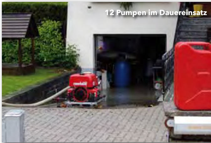
12 Pumpen im Dauereinsatz