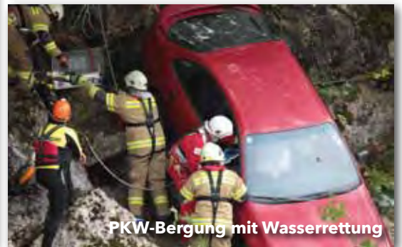
PKW-Bergung mit Wasserrettung