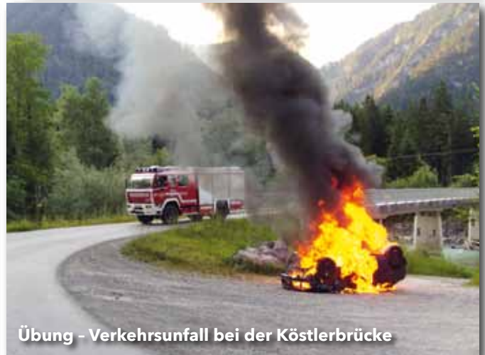
Übung - Verkehrsunfall bei der Köstlerbrücke