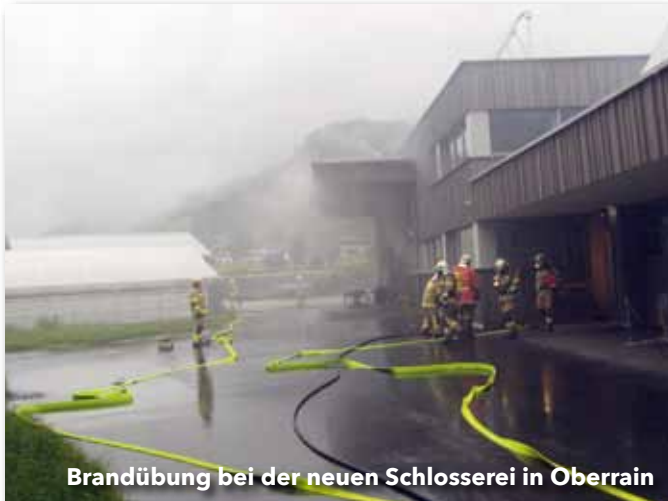
Brandübung bei der neuen Schlosserei in Oberrain