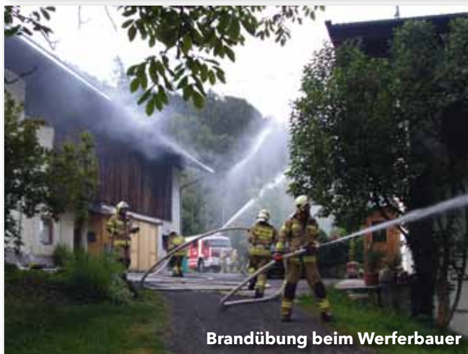
Brandübung beim Werferbauer