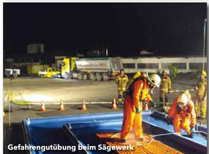
Gefahrenübung beim Sägewerk