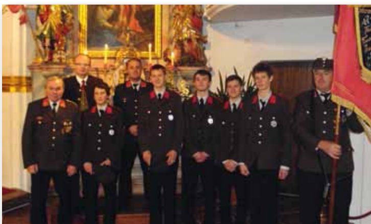
Angelobung der jungen Feuerwehrmänner