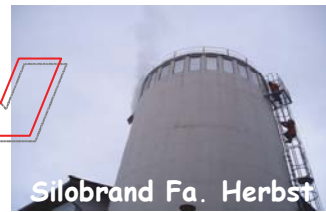
Silobrand Fa. Herbst