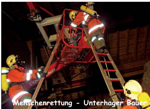
Menschenrettung - Unterhager Bauer