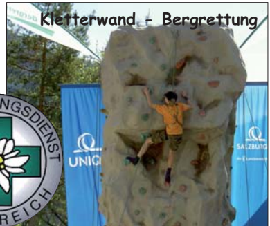
Kletterwand + Bergrettung

Alpin-Notruf 140 Helfen - Retten - Bergen Bergrettung UNKEN