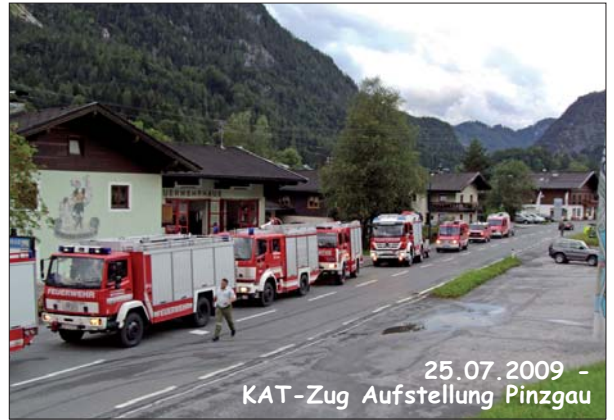
25.07.2009 - KAT-Zug Aufstellung Pinzgau

Das verherende Gewitter mit Hagel, so groß wie Tennisbälle und Sturmböen hinterließ im nördlichen Flachgau ein Bild der Zerstörung. Die Region von St. Georgen über Bürmoos und