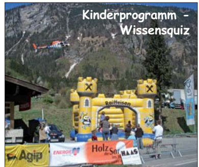
Kinderprogramm - Wissensquiz