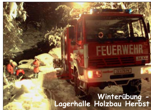
Winterübung - Lagerhalle Holzbau Herbst