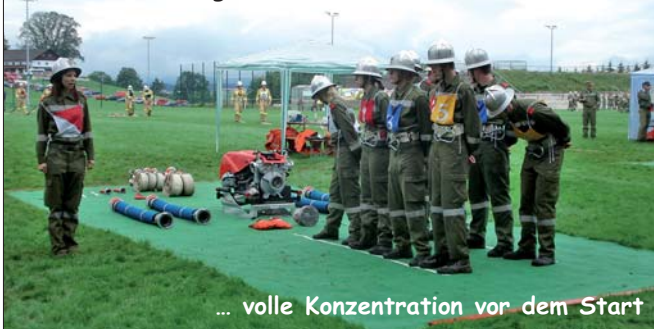
... volle Konzentration vor dem Start

Das Feuerwehrleistungsabzeichen (FLA) in den Stufen I (Bronze) und Stufe II (Silber) gehört zu den wichtigsten Leistungsbewerben in der Feuerwehr. Alle weiteren Bewerbe und Leistungsprüfungen bauen auf diesen auf. Das FLA vermittelt neben den Übungen, Schulungen und Ausbildungslehrgängen das Grundhandwerk eines jeden Feuerwehrmannes. Die Gruppe, bestehend aus 9 Mann, muss in einer vorgegebenen Zeit möglichst fehlerfrei einen Löschangriff durchführen. In der ersten Stufe kann sich die Löschgruppe noch jede Position selbst einteilen. Im Bewerb um Silber wird es dem Zufall überlassen, wer welche der 9 verschiedenen Positionen in der Gruppe ausüben muss.