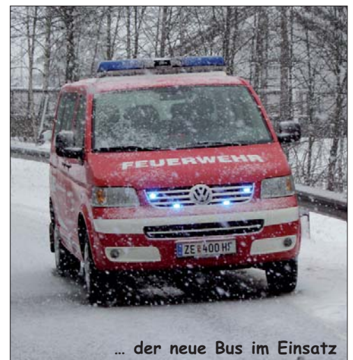
... der neue Bus im Einsatz