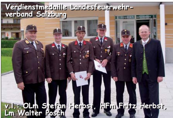
Verdienstmedaille Landesfeuerwehr- verband Salzburg