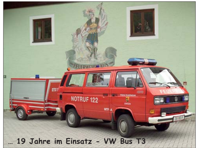
... 19 Jahre im Einsatz - VW Bus T3

Den Fahrzeugumbau und die Ausstattung für den Feuerwehreinsatz führte die Fa. Vierthaler aus Bischofshofen durch.