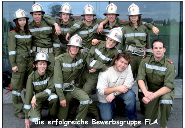
... die erfolgreiche Bewerbungsgruppe FLA