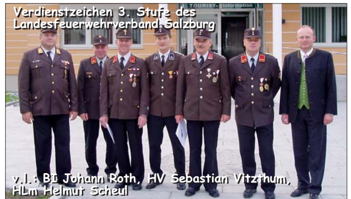
Verdienstzeichen 3. Stufe des Landesfeuerwehrverband Salzburg

Alle Informationen auf www.feuerwehr-unken.at