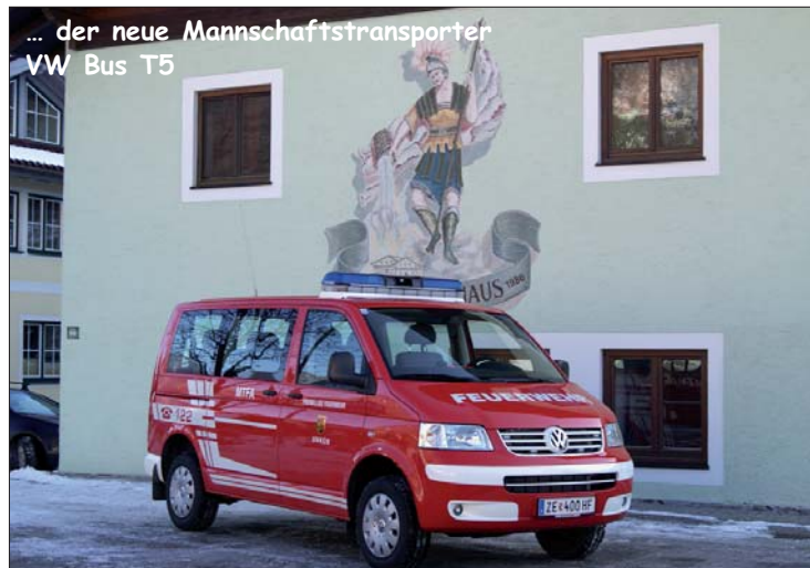
... der neue Mannschaftstransporter VW Bus T5

Dieses Fahrzeug wird bei unserer Feuerwehr als Vorausfahrzeug für den Einsatzleiter, als Mannschaftstransportfahrzeug bei Einsätzen bzw. Übungen, als Zugfahrzeug für den Pumpenanhängers Reit und für Fahrten zur Ausbildung an der Landesfeuerweherschule Salzburg eingesetzt.