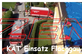
KAT Einsatz Flachgau