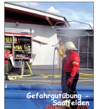
Gefahrgutübung - Saalfelden

Ihr Experte für Versicherung, Vorsorge und Vermögen.