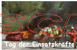
Tag der Einsatzkräfte