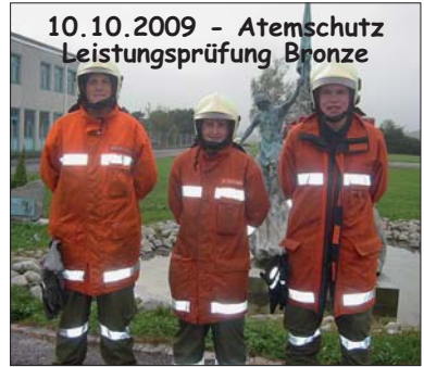
10.10.2009 - Atemschutz Leistungsprüfung Bronze

••••KURZ BERICHTET••••KURZ BERICHTET••••KURZ BERICHTET••••KURZ BERICHTET••••