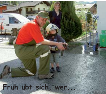
Früh übt sich, wer...