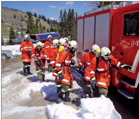
Abschnittskatastrophenübung - Flugzeugabsturz Loferer Alm