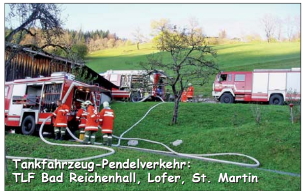
Tankfahrzeug-Pendelverkehr: TLF Bad Reichenhall, Lofer, St. Martin