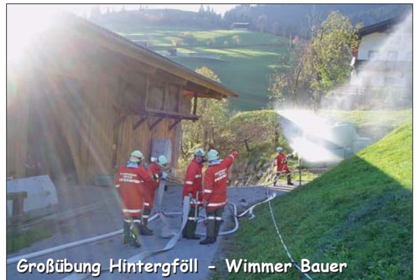
Großübung Hintergöll - Wimmer Bauer

➤ Durchschnittliche Übungsdauer: 2 Stunden